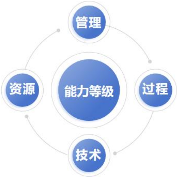
图 2 信息技术产品运行维护服务能力等级模型的构成